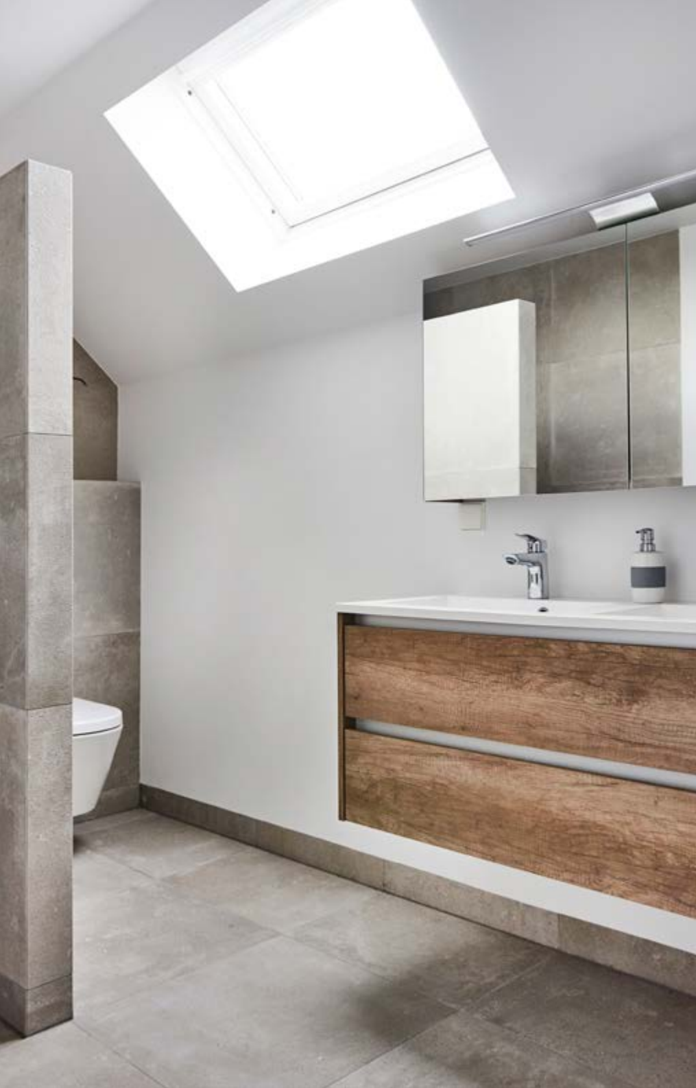
Tegels Porcelanosa uit de serie Dover Acero, bad van Beter Bad (Society wit) en wastafelmeubel in dikke eik (charcoal) van Left Design. De kranen zijn van Hot Bath, serie Buddy. Alles is geleverd door GJ Meijer Sanitair en Tegels. De accessoires zijn van Sissy-Boy Homeland.