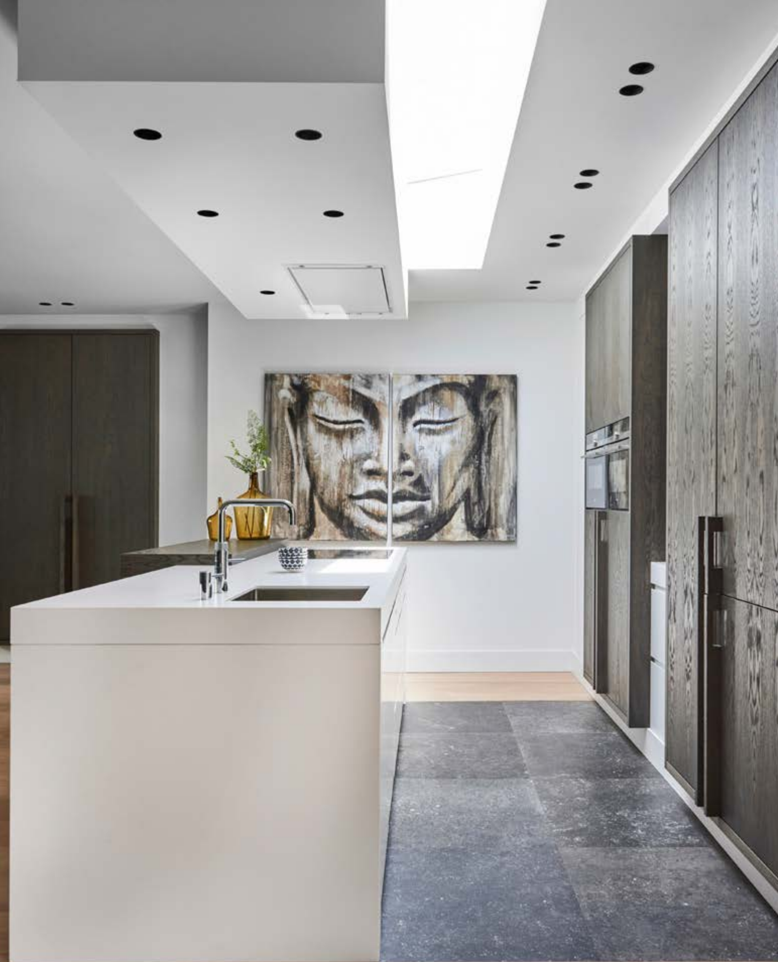
De keuken is op maat gemaakt door IC Woerden naar een ontwerp van Enzo architectuur & interieur en combineert fris wit met warm eikenhout en een praktische tegelvloer. De barkrukken zijn van DTP Import. Het werkblad is van composiet en de apparatuur (stoomoven, combi magnetronoven en inductiekookplaat) is van Siemens. Een smalle lichtstraat zorgt voor veel daglicht.