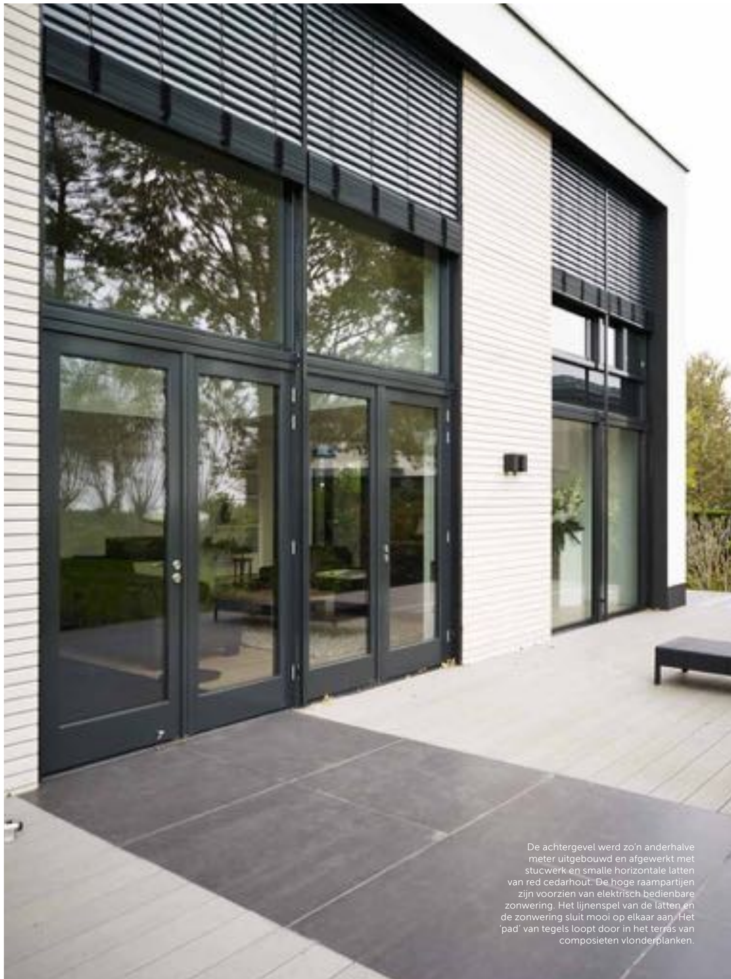
De achtergevel werd zo'n anderhalve meter uitgebouwd en afgewerkt met stucwerk en smalle horizontale latten van red cedarhout. De hoge raampartijen zijn voorzien van elektrisch bedienbare zonwering. Het lijnenspel van de latten en de zonwering sluit mooi op elkaar aan. Het 'pad' van tegels loopt door in het terras van composieten vlinderplanken.