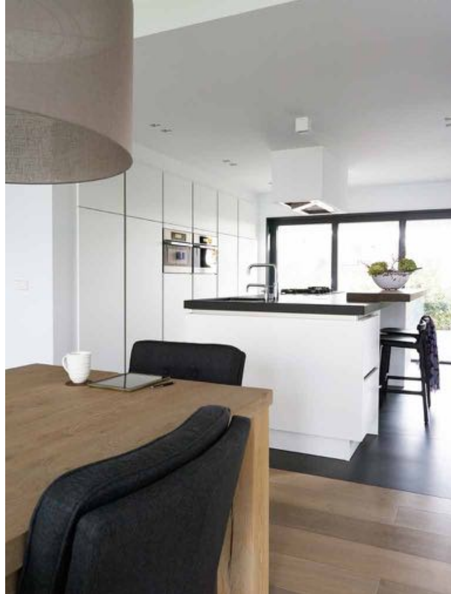
Centraal in de keuken staat een groot kook- en spoeliland met een verhoogd bargedeelte van hout. De houten krukjes zijn van Mattiazzi (via Jan Blaauw). Het aanrechtblad is van zwart graniet. Er zijn nissen gemaakt voor de koffieapparatuur en een wijnklimaatkast.