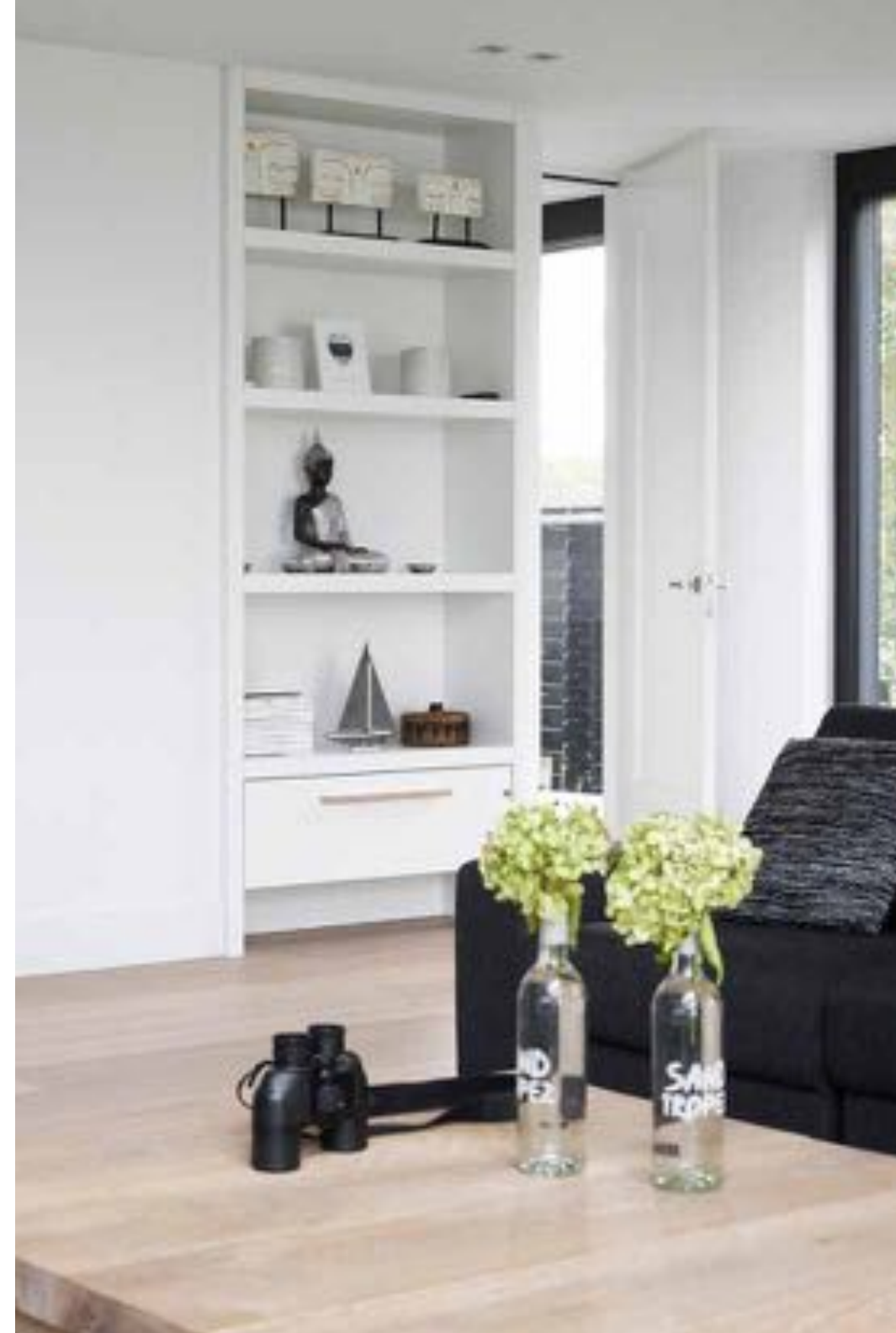
De deur naast de ingebouwde vakkenkast leidt naar de tv-kamer, de favoriete plek van de kinderen.

De vide zorgt in de voorheen donkere kamer voor rijkelijk binnenvallend daglicht en extra ruimtelijk gevoel. De bewoners kochten de bank en de salontafel van eikenhout met poten van rvs bij Melchior Interieur. De vloerlamp Zen komt van bij Illum Kunstlicht.