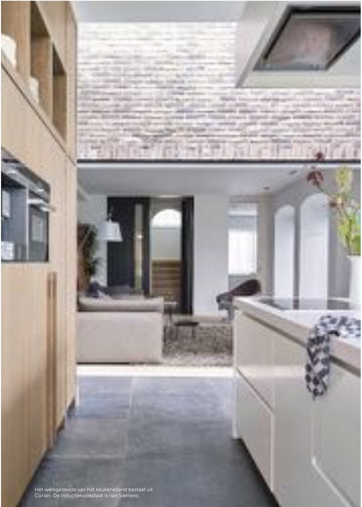
Het werkgedeelte van het keukeneiland bestaat uit Corian. De inductiekookplaat is van Siemens.