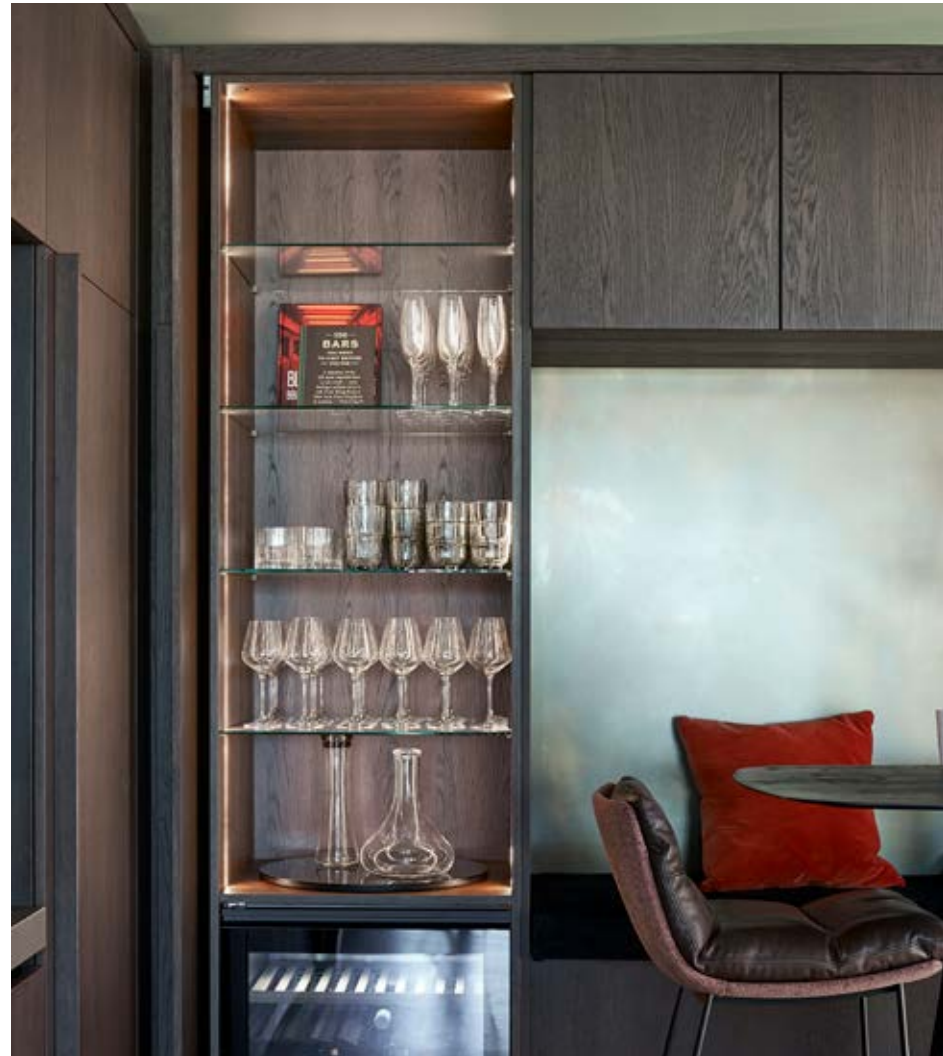
De nis en drankkast in de luxe keuken. Bartafel Stelt van het eigen label Zoen by Enzo van Enzo architectuur & interieur.

'Voor de keuken had de eigenaar een originele wens: deze moest de sfeer hebben van een knus bruin café'