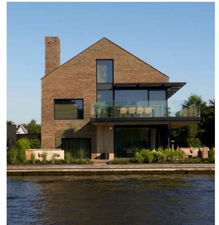
Het vooraanzicht van het pand dat is opgedeeld in twee appartementen. Een ontwerp van Enzo architectuur & interieur.

‘Het penthouse bestaat uit twee verdiepingen en heeft een groot terras en een beschutte loggia’